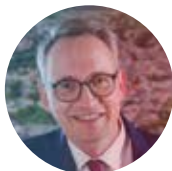
ULRICH PÖTZSCH Oberbürgermeister der Stadt Selb // Starosta města Selb

„Die Bayerisch-Tschechischen Freundschaftswochen sind ein absoluter Glücksfall für die Stadt Selb und unterstützen nachhaltig die gute Zusammenarbeit mit unserer tschechischen Nachbarregion. Der Dank gebührt der Bayerischen Staatsregierung.“ // „Týdny bavorsko-českého přátelství jsou pro město Selb absolutním štěstím a trvale podporují dobrou spolupráci s naším sousedním českým regionem. Poděkování patří bavorské státní vládě.“